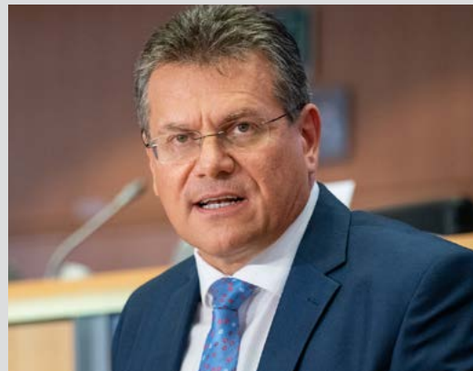
Maroš Šefčovič, az Európai Bizottság intézményközi kapcsolatokért felelős alelnöke

Május 9-én, az Európa-napon megkezdődött az Európai Unió (EU) Európa jövőjéről szóló konferencia Strasbourgbán. Az egy éven át tartó rendezvénysorozat célja az EU helyzetének felmérése, valamint hatékonyabbá, demokratikusabbá és ellenállóbbá tétele. A konferencia hosszú távú célja, hogy az állampolgárok nagyobb szerepet kapjanak az EU jövőbeli politikájának és ambícióinak alakításában.