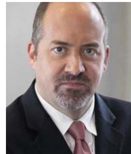
Alvaro Santos Pereira, az OECD közgazdasági főosztályának országjelentésekért felelős részlegének szakértője

Rámutatott, hogy az EU- és az OECD-átlaghoz képest továbbra is magas az adóék, vagyis a munkabért terhelő adók és járulékok aránya. Úgy vélte, hogy az államilag szabályozott, mesterségesen alacsonyan tartott energiahordozó-, ivóvíz-, szennyvíz- és hulladékszállítási díjak nem segítik elő a fejlesztési beruházásokat ezeken a területeken. Kiemelte, hogy a magyarországi szakképzésben nagyon alacsony a gyakornoki programban vagy iparitanonc-rendszerben végzetek aránya, pedig az egyébként is stabil magyar ipari és szolgáltatási szektort ezzel tovább lehetne erősíteni. Megemlítette, hogy Magyarország lemaradásban van az infokommunikációs technológiák