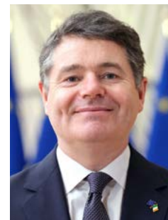
Paschal Donohoe, az Eurócsoport elnöke, ír pénzügyminiszter

Az uniós tagállamok közül Magyarország és Észtország nem támogatja a globális javaslatot, Írországnak is kifogásai vannak. Az eurócsoport elnöke, Paschal Donohoe ír pénzügyminiszter megerősítette: Írország támogatja a multinacionális vállalatok adóztatásának megváltoztatását, de ellenzi a 15 százalékos minimális adókulcsot.