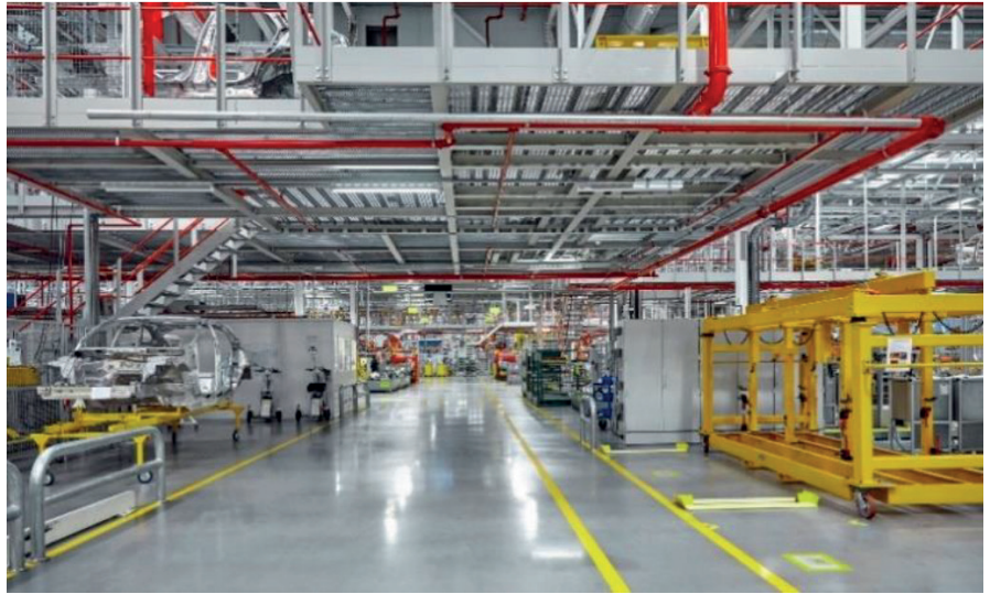
Az autópár helyreállítása a jelenlegi válság után hosszabb ideig fog tartani, mint a 2008-as globális pénzügyi válság utáni időszakban

Az is világos ugyanakkor, hogy a kormányzati intézkedéseket hozzá kell igazítani