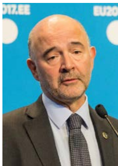
Pierre Moscovici, a gazdasági és pénzügyekért, valamint az adó- és vám- ügyért felelős biztos

az internetes cégek adóelkerülésének minimalizálása érdekében. Teodorovici kiemelte: ha az OECD-reform elbukik vagy halasztást szenved, akkor az EU újra napirendre veszi az ügyet.