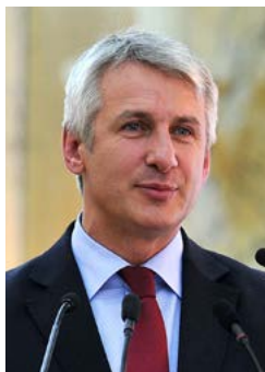
Eugen Teodorovici, román pénzügyminiszter

A fejlett ipari államok alkotta Gazdasági Együttműködési és Fejlesztési Szervezet (OECD) jelenleg ilyen egyezményen dolgozik