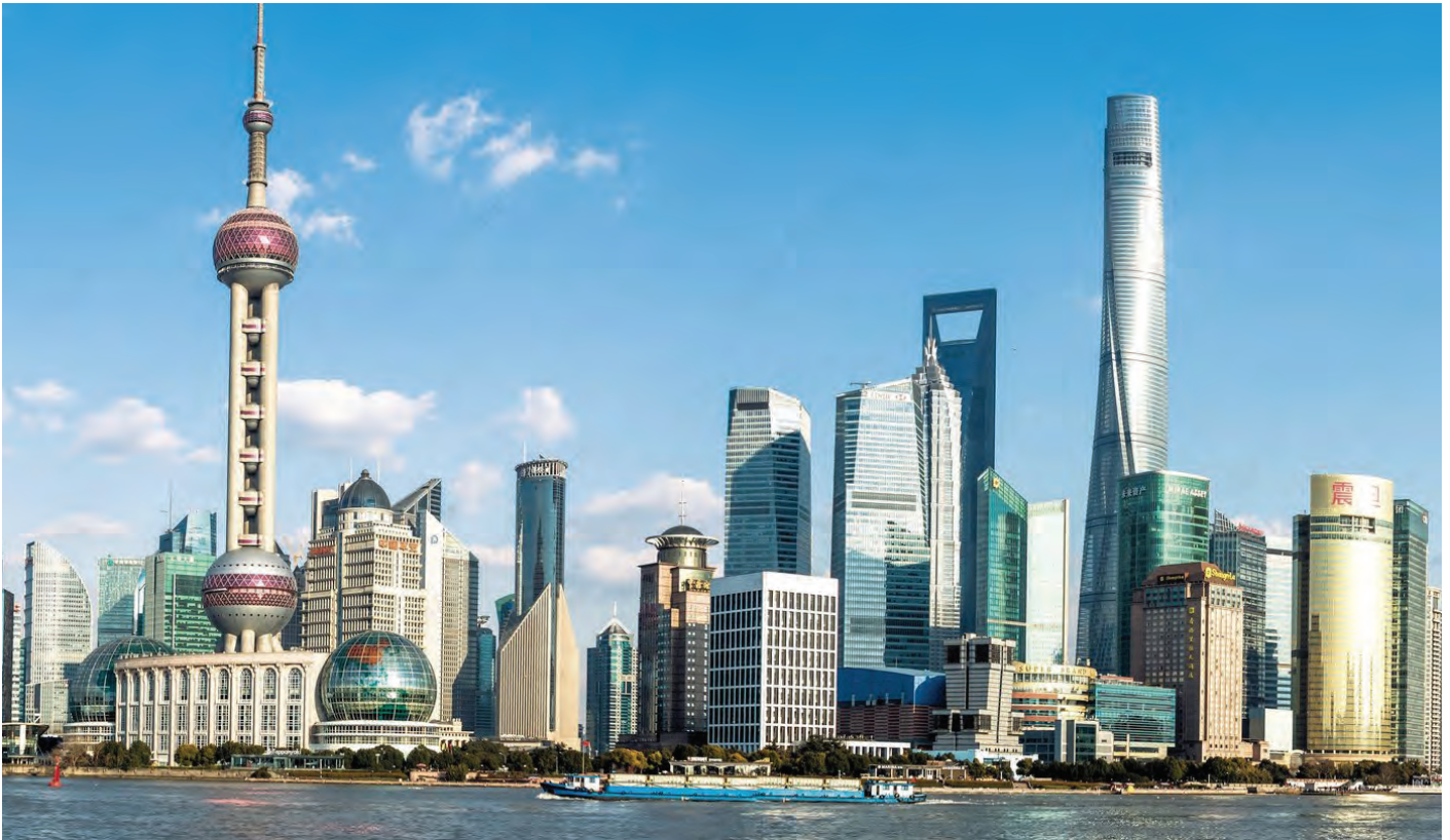
Fenti kép: Sanghaj

rancia miatt duplázni kell, és megint más, ha a kínai jegybank által említett hatalmas mérlegén kívüli kötelezettségállomány a pénzügyi rendszer szereplőin kívül a vállalatokra is részlegesen kiterjed.