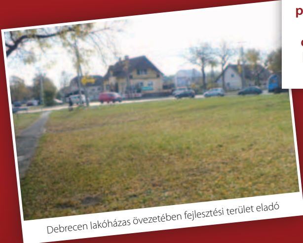
Debrecen lakóházak övezetében fejlesztési terület eladó

Korrekt adatok, piacképes ingatlanok, reális kínálati árak, országos értékesítői hálózat és ingatlan- adatbázis.