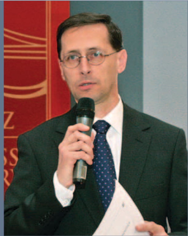
Varga Mihály, a Miniszterelnökség államtitkára

Telt ház fogadta Varga Mihályt, a Miniszterelnökség államtitkárát a legutóbbi csúcstalálkozón, ahol sok szó esett a gazdasági örökségről, de a kormány rövid és hosszú távú üzleti terveiről is volt információ.