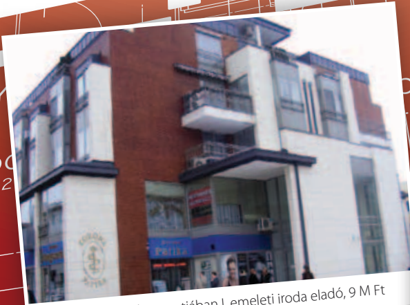
Nyíregyháza központjában I. emeleti iroda eladó, 9 M Ft