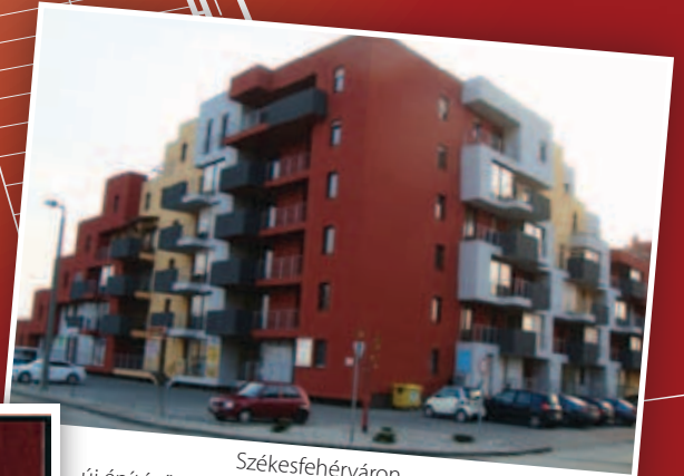
Székesfehérváron új építésű társasházban penthouse lakások eladók