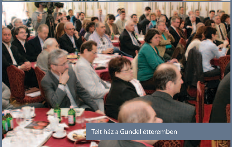
Telt ház a Gundel étteremben