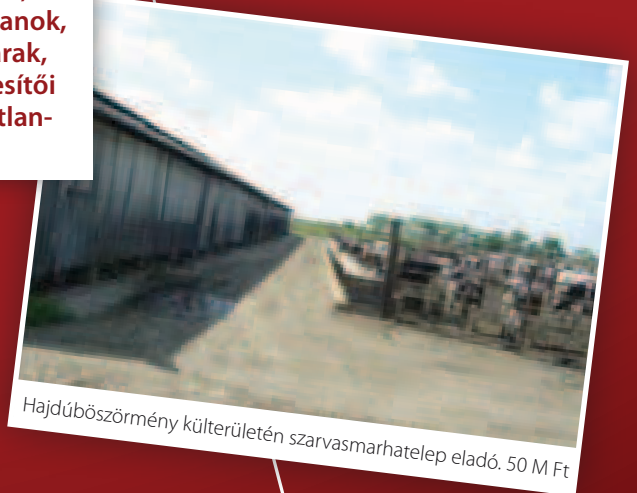
Hajdúböszörmény külterületén szarvasmarhatelep eladó. 50 M Ft