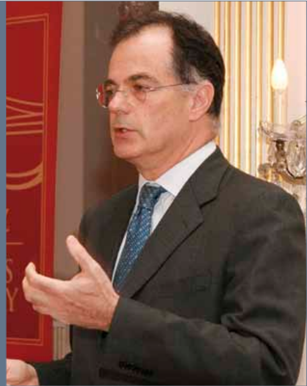
Dr. Simor András, a Magyar Nemzeti Bank elnöke

A vártnál elhúzódóbb lesz a kilábalás, a bruttó hazai termék (GDP) némileg lassabb növekedésével számol a jegybank – mondta Simor András MNB-elnök az MGYOSZ legutóbbi csúcstalálkozóján.