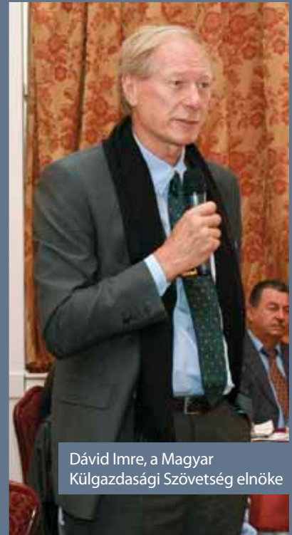
Dávid Imre, a Magyar Külgazdasági Szövetség elnöke