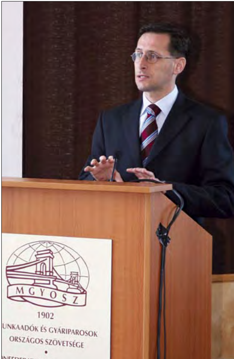
Varga Mihály sem lát esélyt drasztikus adócsökkentésre

■ A Fidesz alelnöke szerint a feketegazdaság kifehéritését csak akkor lehet megvalósítani, ha csökkennek a vállalkozók terhei. Ezzel egy időben nem szabad drámai módon visszafogni a központi kiadásokat. Úgy vélte, semmi esetre sem járható útja a fejlődésnek, ha végleg leépítik az államot, mert a központi beruházások visszafogása lelassítja a gazdaságot, nem segíti a foglalkoztatás növekedését. Az egyensúlyi helyzet és a gazdasági felzárkózás az a két pillér, amelyre a Fidesz aktuális gazdaságpolitikája épül – mondta Varga Mihály. A jelenlegi gazdasági helyzetről azt mondta, hogy a kedvező világgazdasági trendek dacára lassul a magyar GDP növekedésének üteme. Ugyanakkor az államadósság egyre nő; az 1998–2006 közötti intervallumban a bruttó hazai össztermék arányában 61,9 százalékról 67,5-re növekedett. Ezzel ha-